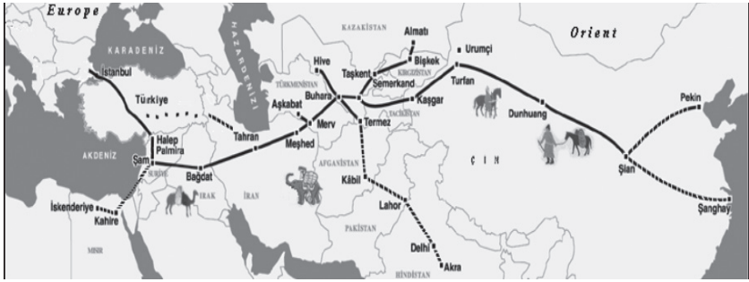
Resim 3. İpek Yolu

İpek Yolu'na, bu yol boyunca en çok taşınan ticaret malı Çin'den getirilen ipek olduğu için bu ad verilmiştir (Türk Ansiklopedisi, 1946XX: 180). İpek Yolu, Çin'den Avrupa'ya kadar doğu-batı arasında bir kuşak gibi uzanan tarihin en eski ve büyük ticaret yollarından biridir. Büyük savaş ve rekabetin yaşandığı bir coğrafyayı kat eden bu yol, ticaret ve ekonomiyi büyük ölçüde yönlendirmiş ve etkilemiş olan dünyanın ilk Asya-Afrika yol bağlantısı olmuştur. Bu yol takip edildiğinde insanların "seyahatleri, taşıdıkları mallar ve emtia" hakkında bilgiler elde edilebilmektedir. İpek Yolu'nun doğu ile batıyı birbirine bağlayan ana karayolu niteliğinde olması, buradan yüksek bir gelir elde edilmesi ve bunun Türk ve İslam dünyasının elinde kalması, Batı Avrupalıların yeni yollar aramasına yol açmıştır. Avrupalıların büyük coğrafya keşifleriyle yeni yollar elde edilmiş, bu da İpek Yolu'nun rolünü ve değerini düşürmüştür. Günümüzdeki siyasi anlaşmazlıkların halen bu yol üzerinde olduğunu, Haçlı seferlerinin de asıl amacının İpek yolunun cazibesi olduğu görülmektedir. Ana vatanı Çin, ihraç noktası Doğu Türkistan olan İpek, ticarete para yerine kullanılmış, altın gibi saklanmış ve MÖ 206'dan itibaren Çin ekonomisinin temel unsurlarından biri hâline gelmiştir. Çin İmparatoru MÖ 177'de Hun hükümdarının tevaccühünü kazanmak için "işlemeli, nakışlı, pamuk konmamış bir ipek