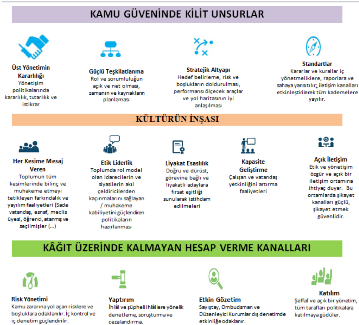
Şekil 2: Kamu Güveni Modeli (OECD)